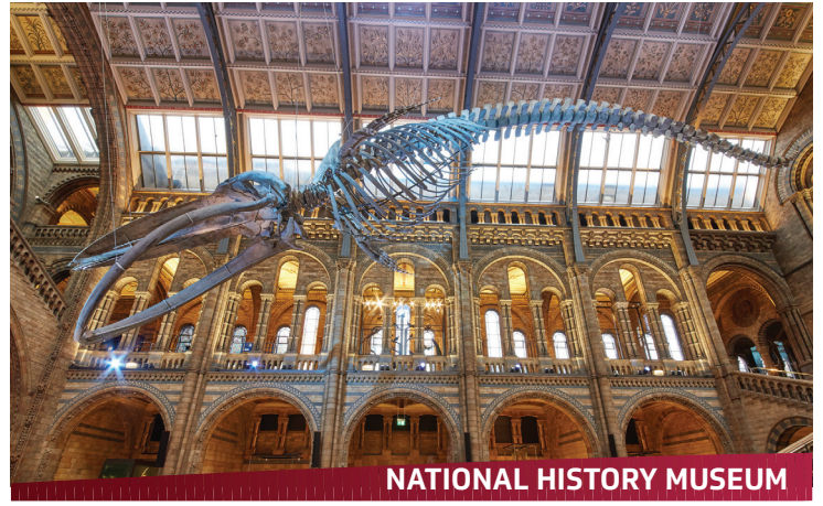
NATIONAL HISTORY MUSEUM